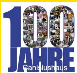
Grafik: Martin Sauter

2026 feiern wir auch 100 Jahre Canisiushaus! Dazu ist eine 84-seitige Festschrift erschienen. Sie kann zum Preis von 10 € beim Pfarrfest und bei Veranstaltungen im Canisiushaus erworben werden.