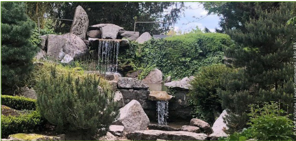
© Stadt Karlsruhe | Layout: Zimmermann | Bild: FBA